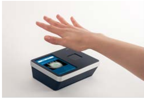
写真:「PalmSecure Connect」で認証している様子