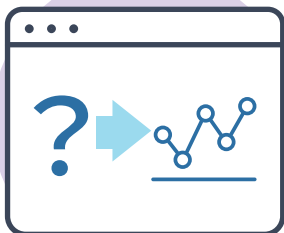
「あいまいさ」数値化