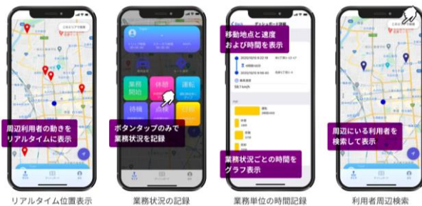
リアルタイム位置表示

https://www.cec-ltd.co.jp/promotion/connected/mobilityiot/pluslocation/