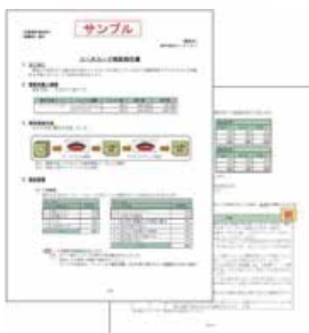
ソースコード診断結果