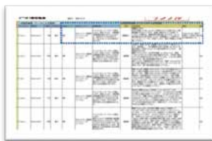
ドキュメント診断結果