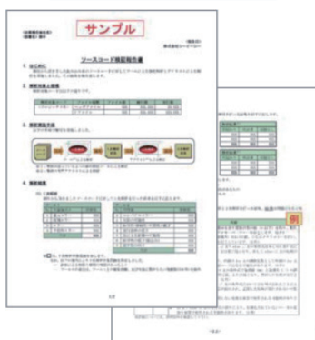
ソースコード診断結果